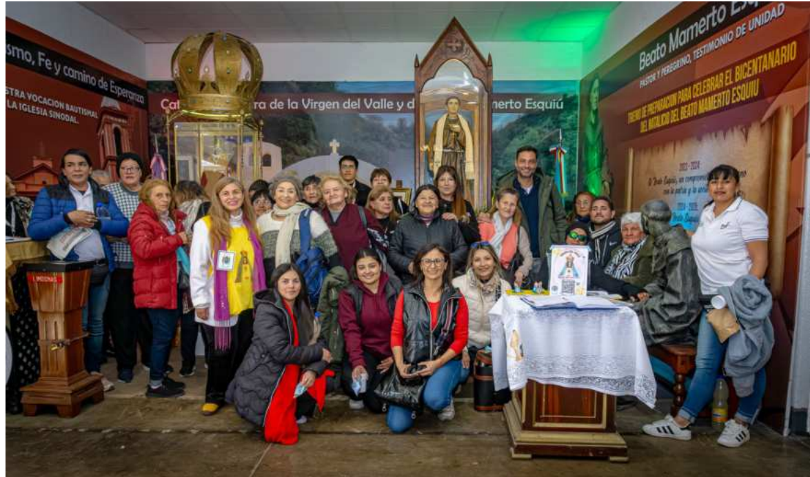
Los momentos más felices se viven entre pares, con muchas actividades.

generen actividades de esparcimiento y distracción para sus pares. Cada encuentro que lleva adelante la Secretaría de Desarrollo Social, los une en un almuerzo de camarade-