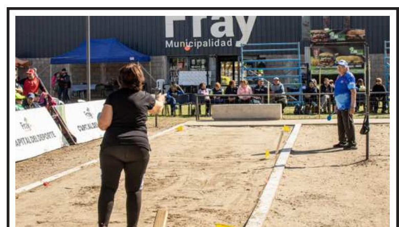
Estrenamos la cancha de tejo del Evita con un torneo espectacular. Un nuevo espacio para la práctica de una nueva disciplina.