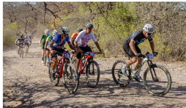
En septiembre vivimos el Desafío Fray.

de Clubes "C" NOA Damas, llevado a cabo del 24 al 27 de abril, y el Campeonato Argentino de Selecciones Sub 14 "D", desarrollado entre el 11 y el 14 de septiembre, con la participación de delegaciones provenientes de Catamarca, Sur de Córdoba, Sur de Entre Ríos, Corrientes, Cuenca del Salado, Chubut, Jujuy e incluso Chile. Todo esto impulsa el turismo y fortalece a nuestros emprendedores. Además de ser un pulmón deportivo con talleres gratuitos para niños y adultos, un punto de referencia deportiva único.