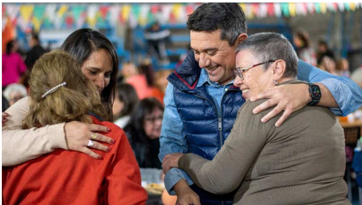
Con acciones, obras y servicios llegamos a la comunidad todo el año.

Impulsamos encuentros que son más que eventos: “Mujeres de Fray”, “Por Siempre Jóvenes” y otras iniciativas que promueven diálogo, participación y progreso. En deporte, organizamos eventos masivos, consolidamos a Fray como el departamento con más competencias anuales y ofrecemos 17 disciplinas gratuitas en los predios Maradona, Evita y la Cancha de Hockey, ya reconocidos entre los mejores del Valle Central. A la par, generamos espacios culturales para fortalecer la identidad local y a los emprendedores. En infraestructura, avanzamos junto a la Provincia con el plan de pavimentación: asphaltamos Álvarez Condarco y Gregoria Matorras en el acceso al Estadio Evita, y pronto completaremos la avenida Ramón Rosa López que lleva hacia el Jardín Botánico cuya primera etapa ya está lista. El asfaltado fue reactivado con el apoyo del gobernador Raúl Jalil, solos no hubiera sido posible. Alcanzamos el 90 % de iluminación LED, llevando un servicio moderno y más seguro a barrios de todas las localidades. Recuperamos espacios verdes —como la plaza Brenda Micaela Gordi-