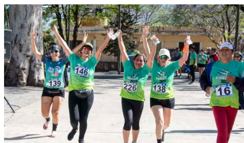
Iniciamos octubre con el Fray Corre.