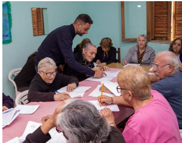
Se realizan talleres en San Antonio y Piedra Blanca.

Este año incorporamos un nuevo programa destinado a nuestros adultos mayores: los Talleres de Estimulación Cognitiva. Los talleres están diseñados para mantener y mejorar las funciones cognitivas, como la memoria, la atención, el lenguaje, el razonamiento y la velocidad de procesamiento en nuestros adultos mayores. También se trabaja la motricidad y las funciones ejecutivas.