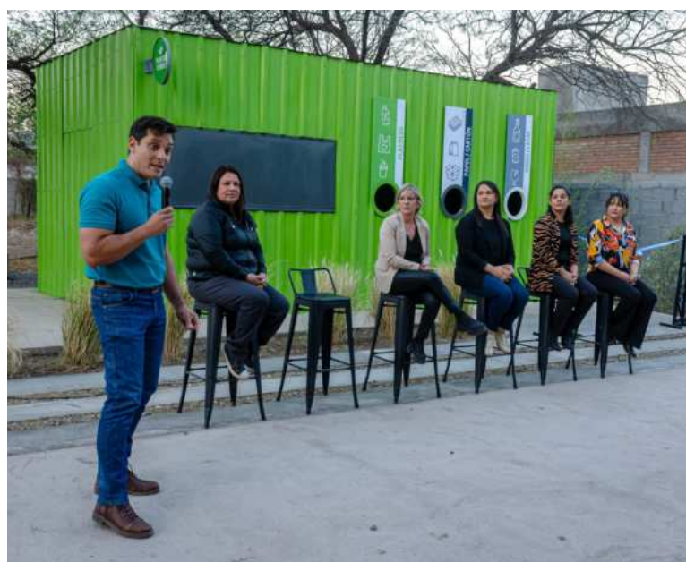
Trabajamos para cuidar nuestro planeta.

sario, en Piedra Blanca. La idea es que allí se depositen papel, cartón, plásticos y vidrio, materiales que pueden tener una segunda oportunidad. Entre todos podemos colaborar con el cuidado del medio ambiente y trabajar por un Fray más limpio y más lindo.